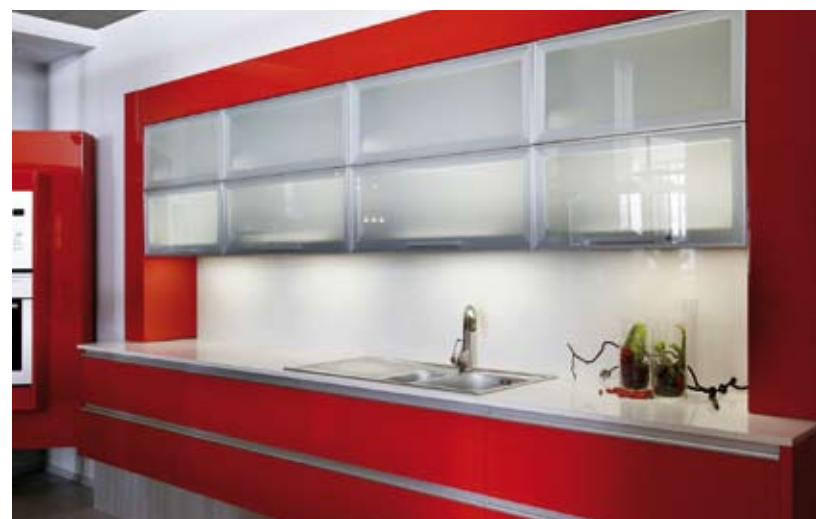
Uniwersalność, wydajność i powtarzalność to podstawowe cechy KROMOSYSTEMU.